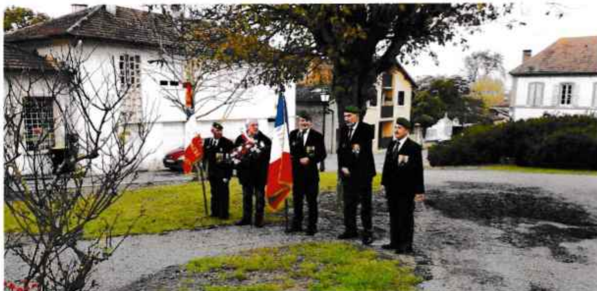
Le Maire, entouré d'anciens légionnaires, prêt à déposer la gerbe devant le monument aux morts