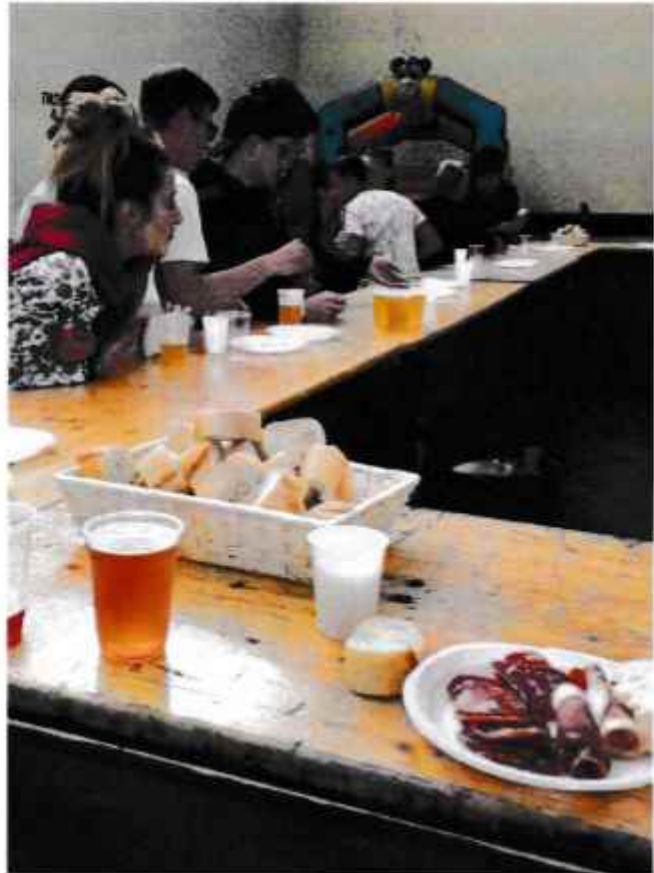
Le château gonflable pour les enfants et les tapas pour les adultes