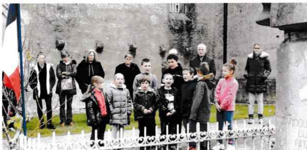
La population et les élèves de l'école qui ont entonné la Marseillaise