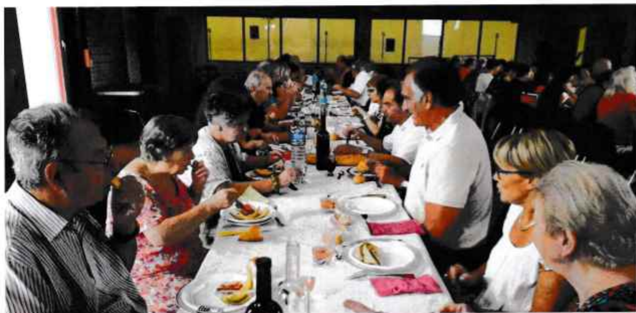
Les habitants en train de savourer le repas