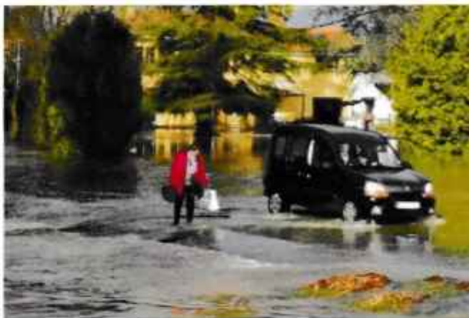
L'Adour en crue et le difficile passage pour les voitures et les piétons.