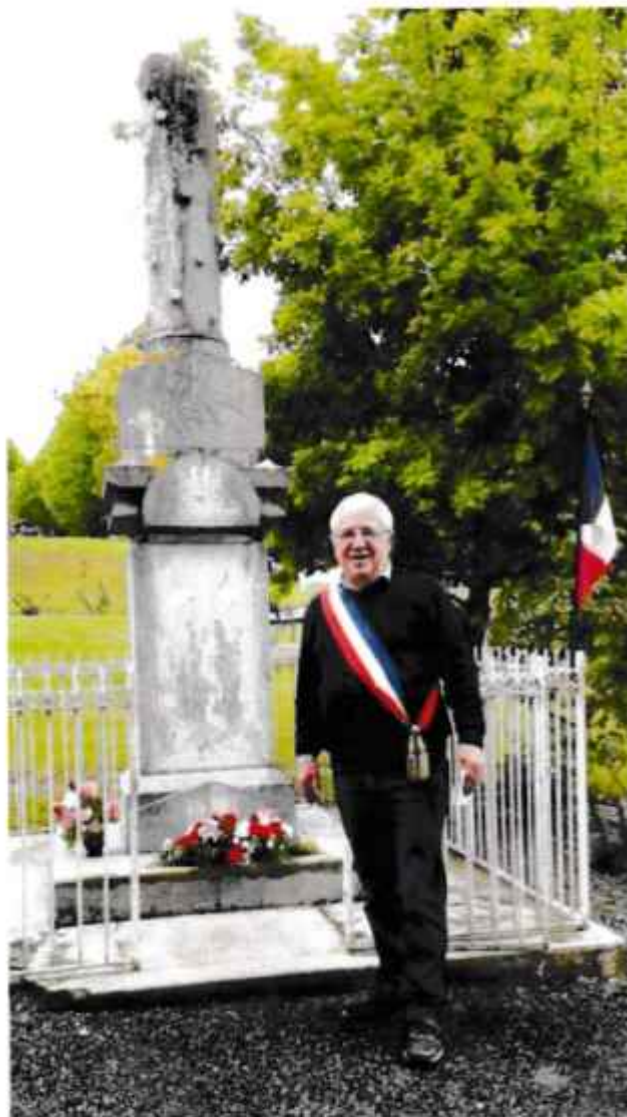
Monsieur le Maire lors du dépôt de gerbe le 8 mai 2019