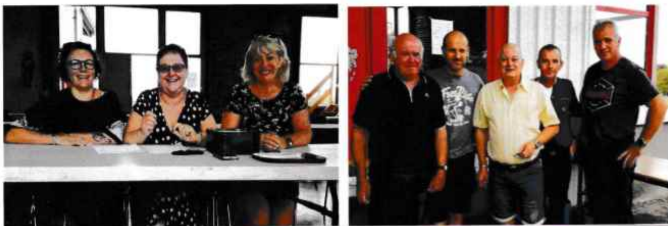
Les « gentils organisateurs »

Merci à toutes les personnes qui ont permis la réalisation de cette journée.