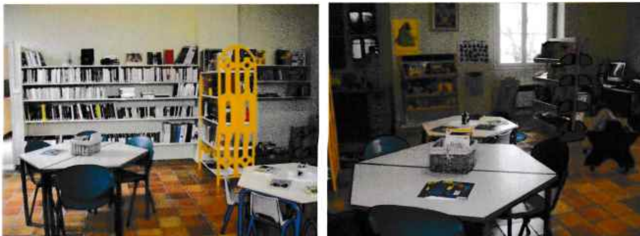
La bibliothèque pour les adultes et les enfants

Pascaline s'occupe aussi de la bibliothèque : elle peut commander des livres sous forme de prêt ainsi que des DVD. Le bibliobus passe deux fois par an pour renouveler le stock de livres. Les institutrices ont décidé d'amener les enfants de l'école pour pouvoir profiter de ce lieu.