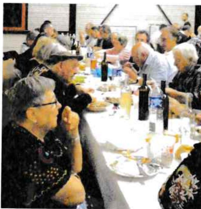
L'invitation du repas et les participants venus se régaler