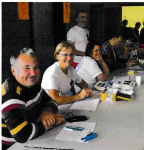
Le « bureau » des inscriptions