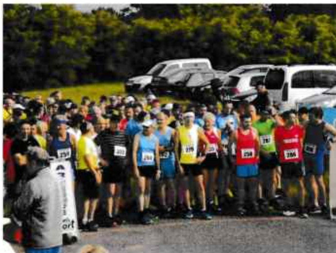
Les participants attendent le départ