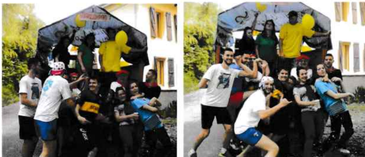
La sérénade et les joyeux « festayres »

Le samedi matin, la sérénade est passée dans toutes les maisons. Les jeunes du village ont circulé avec le tracteur tout en jouant de la musique. L'accueil des Lafitolais est toujours sympathique et nous les en remercions. Le soir a eu lieu le bal. Le lendemain après midi, des joueurs ont participé au concours de pétanque tandis que les enfants ont préféré s'amuser aux jeux proposés. Le soir, la soirée « tapas » a permis à la population de se retrouver autour d'un apéritif.