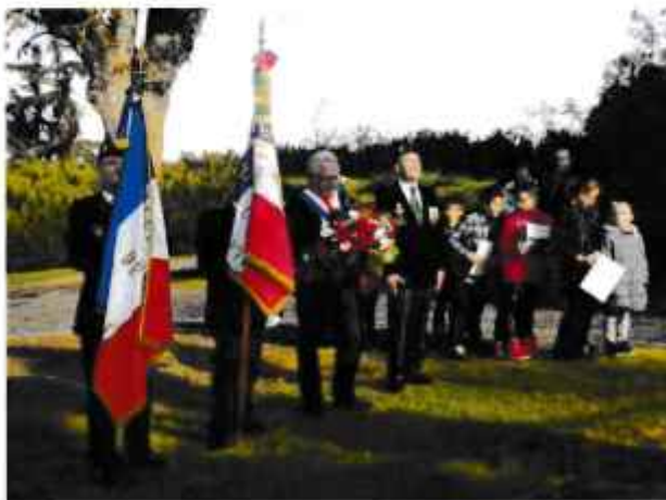
Monsieur le Maire dépose une gerbe

Un vin d'honneur a été offert par la mairie pour clôturer cette commémoration.