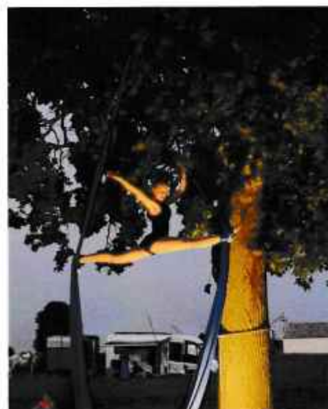
Emma au tissu aérien