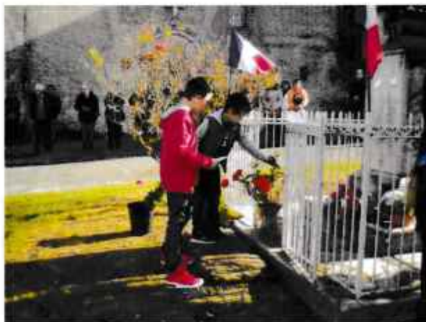
Les enfants déposent une fleur