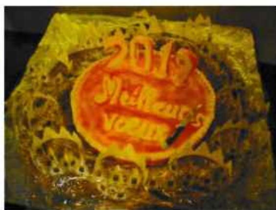
La « super » galette