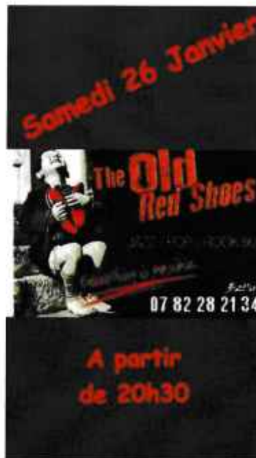
l'invitation pour les finales