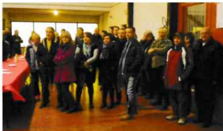
Les Lafitolais écoutent le discours du maire

Ensuite, le public a partagé l'apéritif dînatoire (charcuterie, pizza et quiche, tranches de rôtis, fromage et galette des rois) dans une ambiance très conviviale.