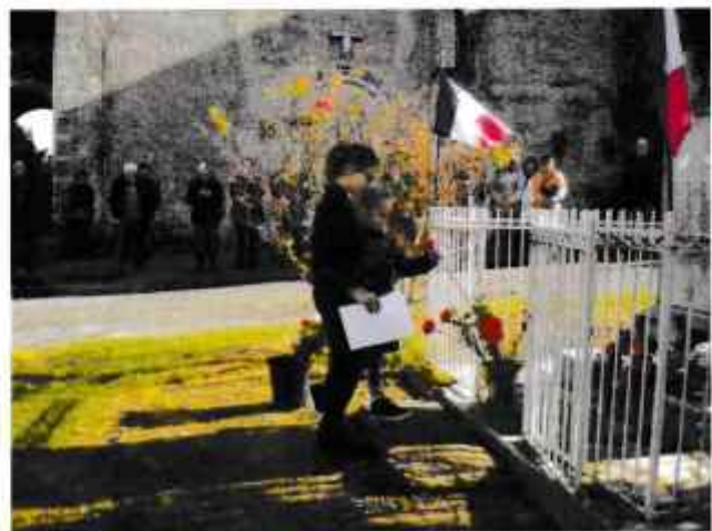
Les enfants déposent une fleur