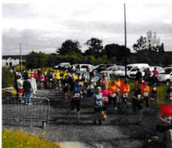
Le départ est donné