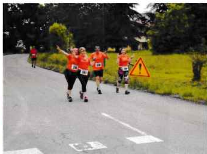
La course se passe dans une bonne ambiance.