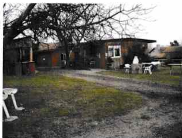
Une vue du « Western Paradise »

Si vous êtes intéressés, vous pouvez téléphoner au 06 82 33 40 68 ou vous reporter au site www.westernparadise.fr