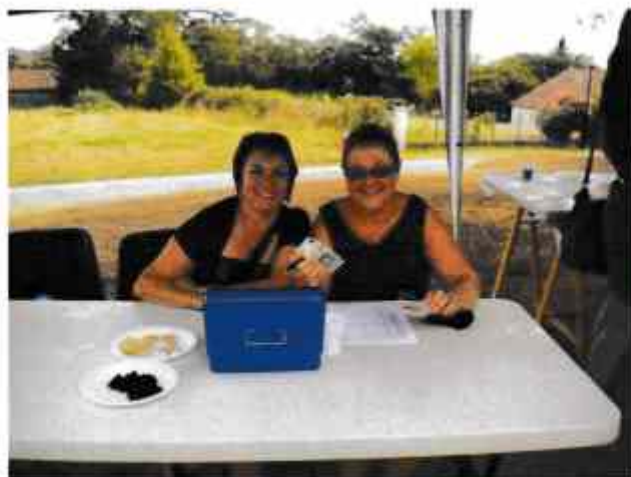
Les femmes en train d'encaisser le prix du repas !