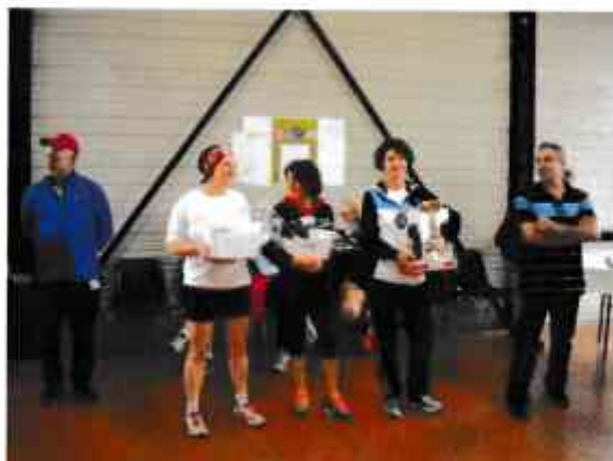
la remise des récompenses