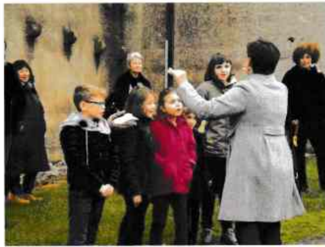
Le monument aux morts honoré et les enfants de l'Ecole chantant la Marseillaise