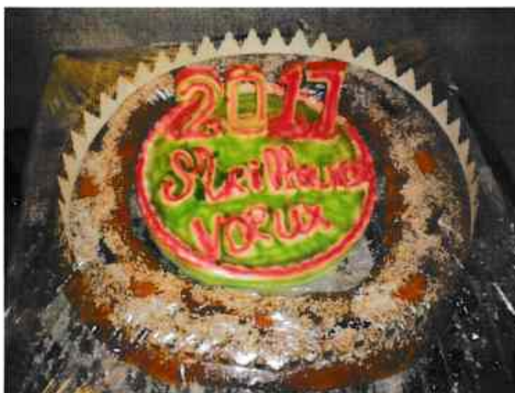
La galette de un mètre de circonférence