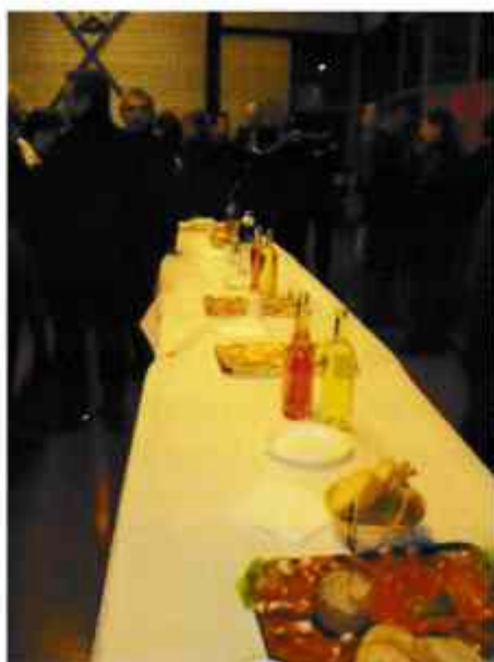
Les « tapas »

Ensuite, le public a partagé l'apéritif dînatoire et a dégusté une immense galette des rois dans une ambiance très conviviale.