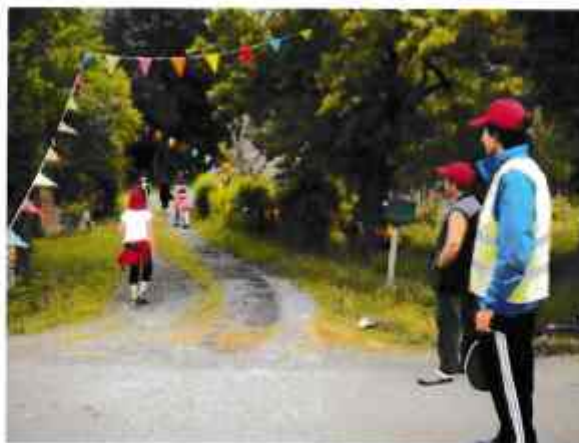
les G.O. ou Gentils Organisateurs