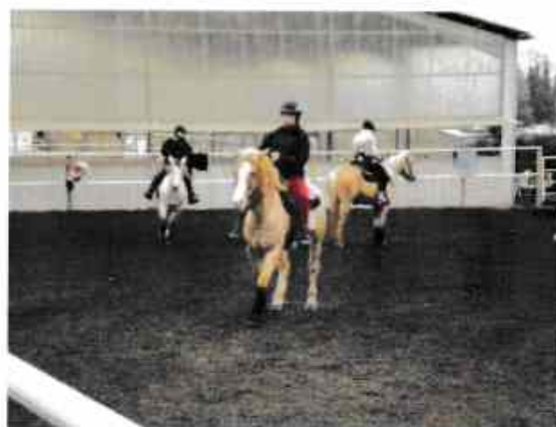
Les élèves au travail