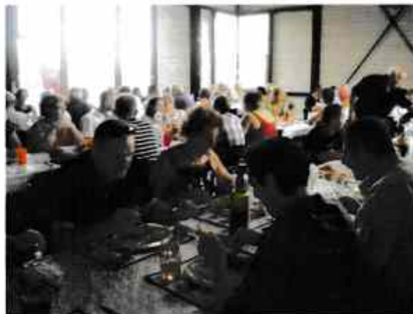
Des tables pleines