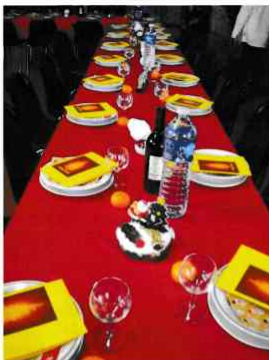
Une table bien décorée et les chanteurs bigourdans

Merci à tous ceux qui ont participé à la préparation de ce repas afin de rendre cette journée agréable pour nos anciens.