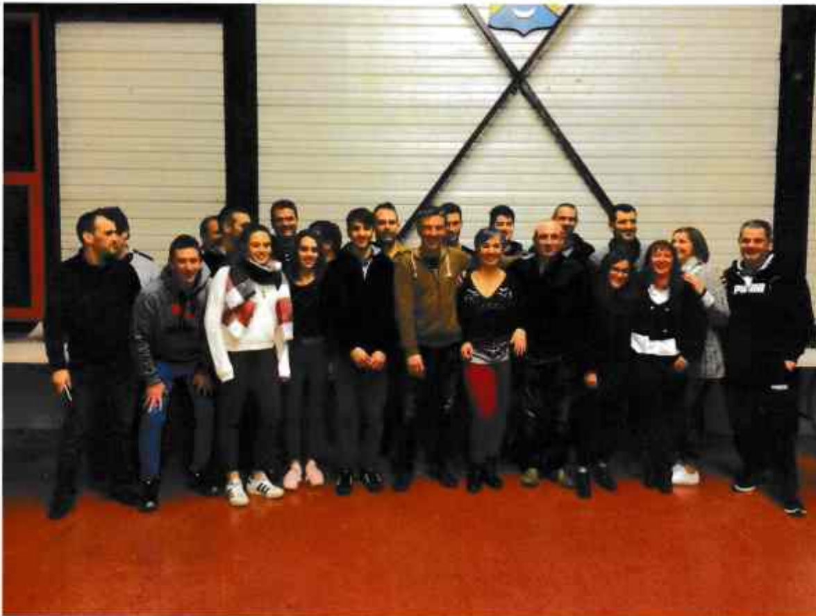
Quelques participants et les bénévoles investis dans l'organisation de ce tournoi. Merci à tous