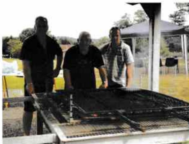
Les hommes en train de faire griller la viande !