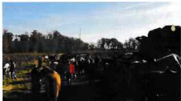
Une belle journée pour faire une agréable promenade