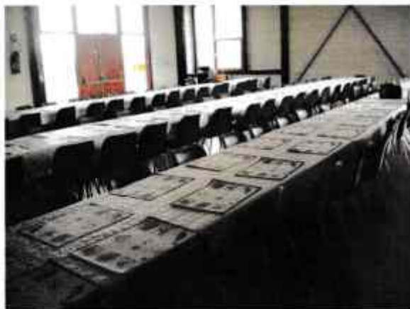
Des tables vides

Merci à toutes les personnes qui ont permis la réalisation de cette journée.