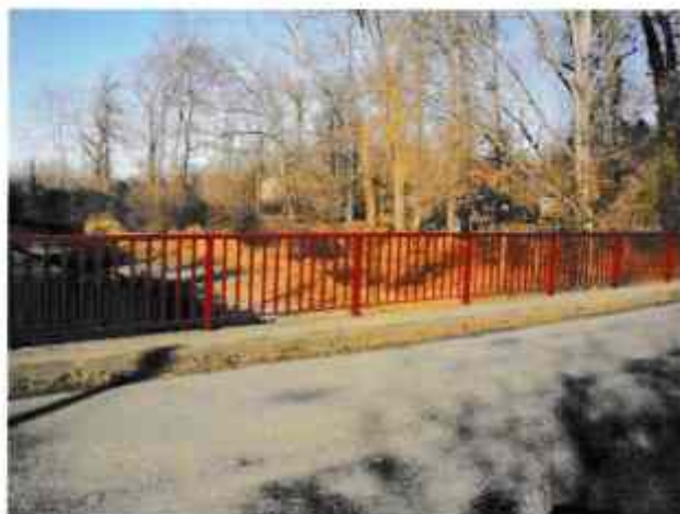
Une nouvelle jeunesse pour le pont sur l'Adour