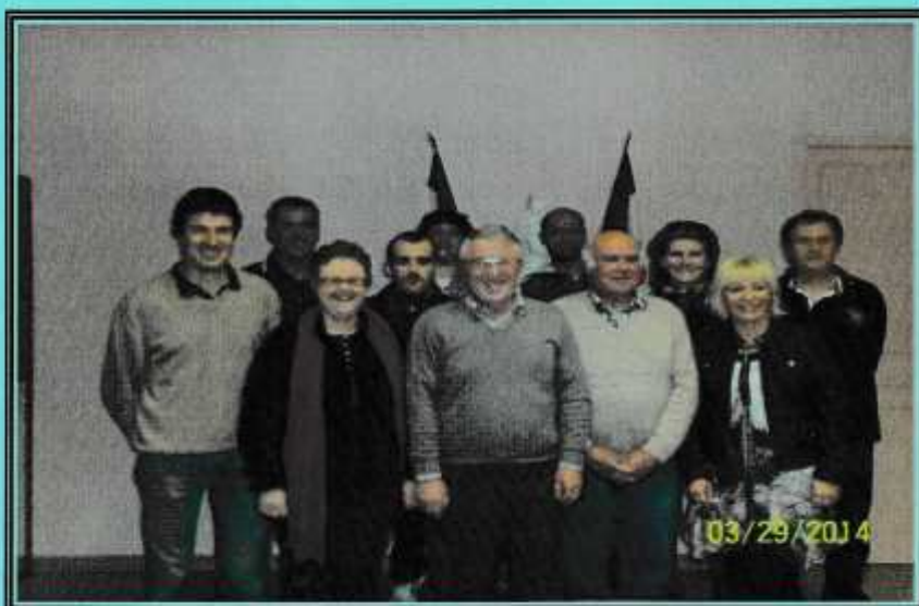
Le conseil municipal

D'azur au chevron d'or accompagné de trois croissants d'argent