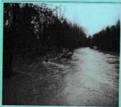
L'Adour en face de chez M.BIROU